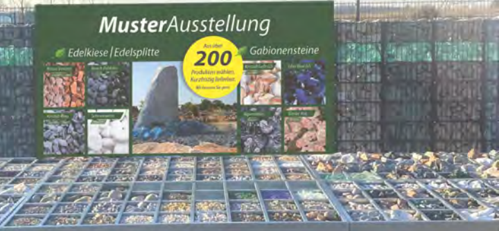
Alle Preisangaben wegen möglicher Irrtümer, Druckfehler und Änderungen unter Vorbehalt. Stand 02/2025

Aus über 200 Produkten wählen. Kurzfristig lieferbar. Wir beraten Sie gern.